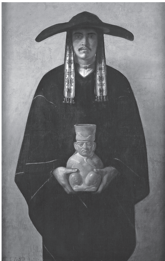
Imagen 4. «Indio alfarero» o «El habitante de las cordilleras» (Francisco Laso, 1855).

Y para probarlo basta ver televisión, leer la prensa y escuchar al ex presidente Alan García decir, por ejemplo, que «si el Perú fuera plano ya hubiéramos salido del atraso», 63 culpando a la geografía de lo que