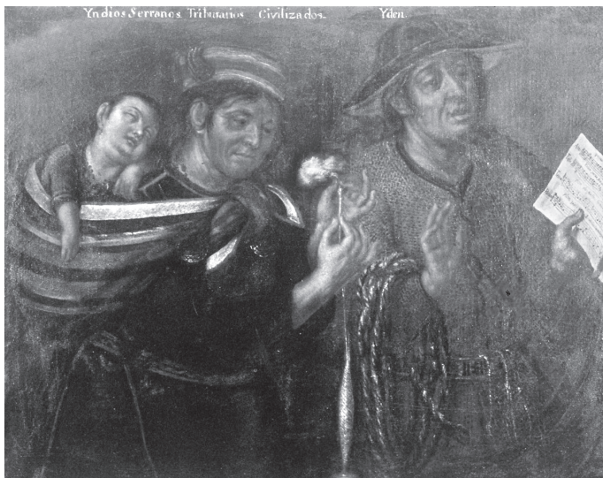
Imagen 2. «Indios serranos tributarios civilizados» (Cuadros de castas, tomado de Natalia Majluf)

y Juan Carlos Estenssoro— endureció la percepción ilustrada con respecto al «indio». 45 Queremos recalcar, una vez más, que no se trata de una concepción ilustrada en abstracto, sino de una percepción específicamente limeña. Resulta interesante —pero no sorprendente— a este respecto que el Mercurio Peruano no registre en sus páginas memoria alguna de la rebelión de Túpac Amaru II (1780-1781), a poco más de una década del evento. Un silencio más que estentóreo, tratándose de la mayor sublevación contra el poder colonial en Sudamérica antes de las guerras de la independencia. En cambio, este hecho está presente, mediante la partitura de una tonadilla dedicada al inca rebelde, en el registro pictórico de Martínez de Compañón, realizado poco después